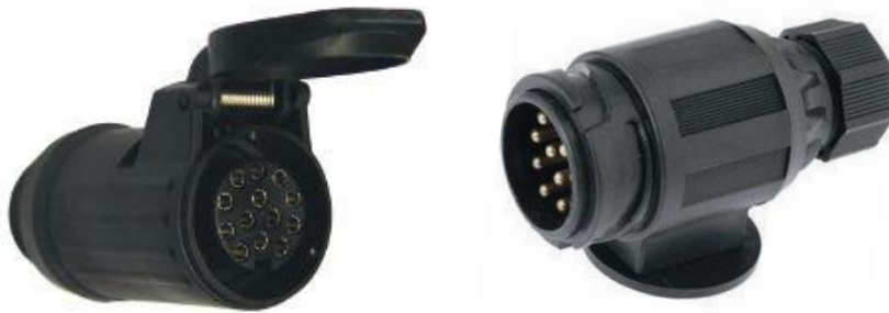
ISO 11446 13 pin