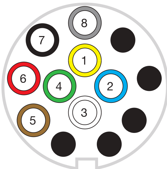
ISO 11446 8 pin